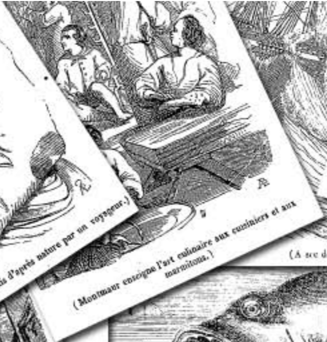
(Montmar enseigne l'art culinaire aux cuisiniers et aux marmitons.)