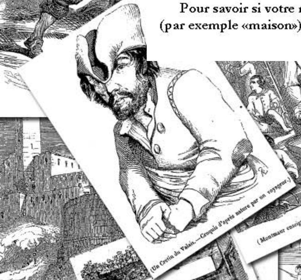
(Un Crotin du Palais. — Croquis d'après nature par un voyageur.)

Ce document répertorie dans les signets latéraux, au fur et à mesure de l'avancement des travaux, les gravures du magasin pittoresque de 1833 à 1899. Pour savoir si votre requête est fructueuse après avoir tapé votre mot-clé (par exemple «maison») n'oubliez pas de valider l'option « inclure les signets ».