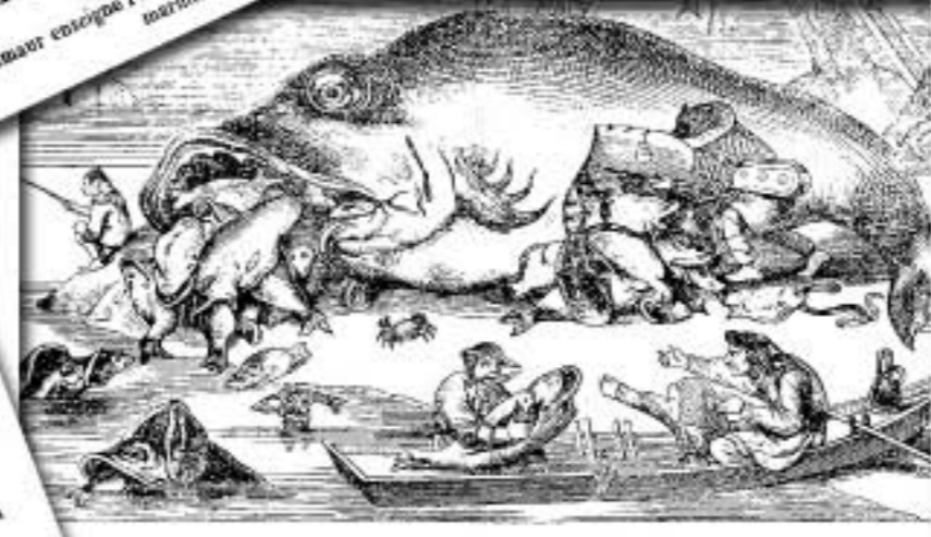
(Les gros poissons mangent les petits poissons) — d'après Pierre Broughal.