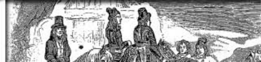
(Scène des jeux olympiques, d'après une peinture de Barry.)