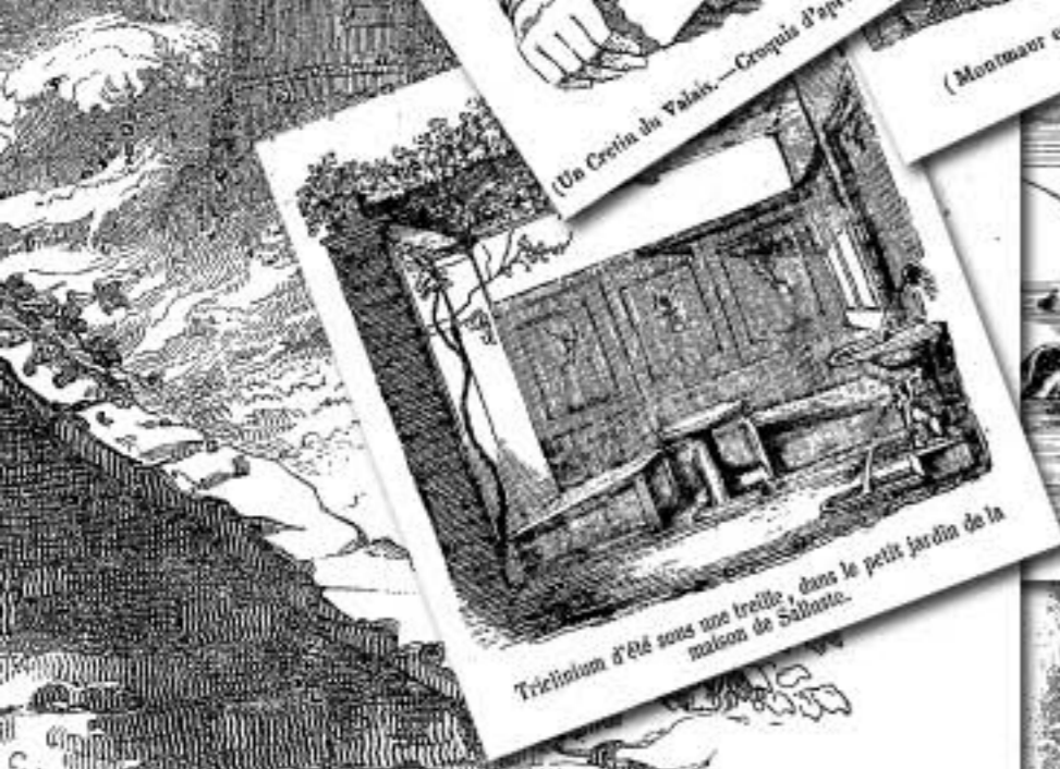
Trichotom d'été sous une treille dans le petit jardin de la maison de Sébaste.